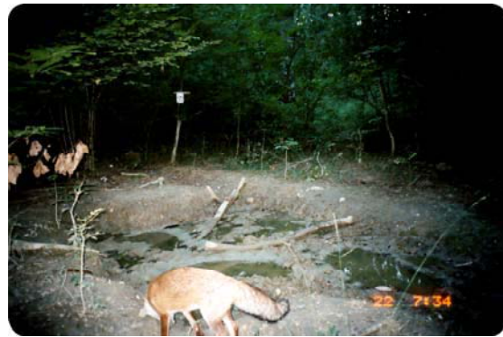
Par l'odeur alléché, Maître Renard flaire une aubaine...