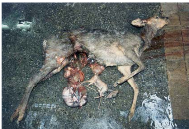
Chevrette portante éventrée par un chien.

A cela s'ajoute les dérangements causés aux autres usagers et aux cultures.