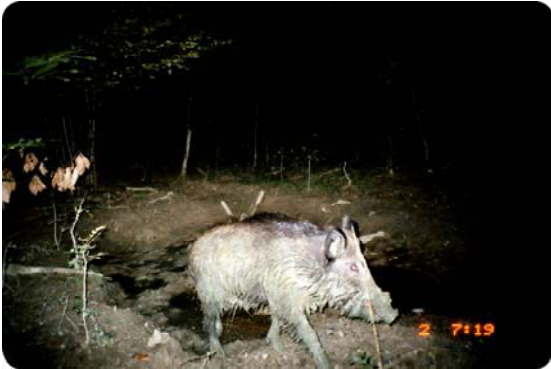
Mâle solitaire à la recherche de laies en chaleur.