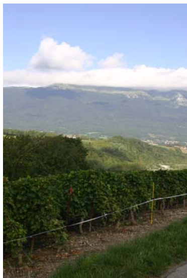
Vigne clôturée avec vue sur le jura.

FAUX. Il y a actuellement 15 gardes au SFPNP pour s'occuper de la gestion de la faune, de la pêche, des réserves naturelles et du public en campagne et en forêt, soit un effectif du même ordre que celui des années 90. En revanche, deux spécialistes de la grande faune ont été mandatés pour mieux connaître le sanglier et prévenir ses dommages aux cultures. Ces mandataires sont assistés dans leur travail par différents stagiaires, diplômants et civilistes; il y a donc provisoirement plus de gens actifs sur le terrain.