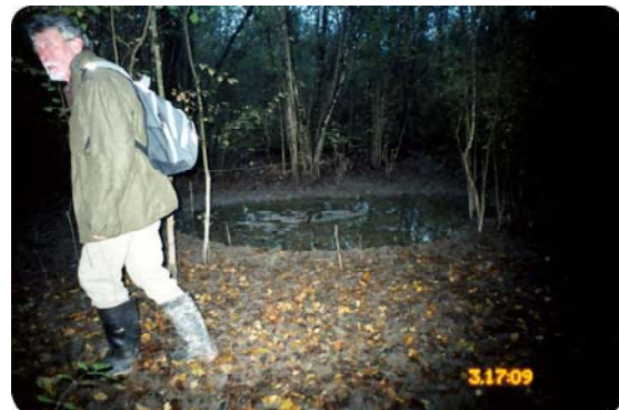
Si même en forêt on se fait flasher... !!