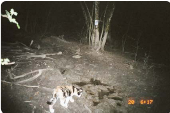
Minou intrigué par le monde sauvage.