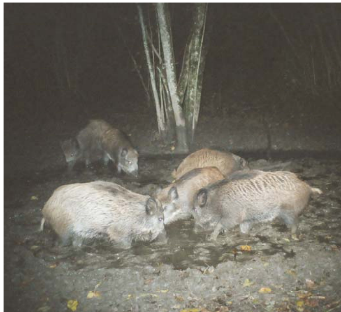
Harde composée d'une laie meneuse, de plusieurs laies subadultes et de bêtes rousses (jeunes de l'année) photographiées par un piège-photos dans le cadre d'un recensement de population.

L'évaluation de la population de sangliers est difficile (animaux nocturnes et discrets). La méthode développée par le SFPNP consiste à utiliser des pièges photos sur des sites agrainés avec du maïs, afin de dénombrer la population. Une analyse des résultats a permis, en juin 2003, d'estimer les effectifs à près de 400 sangliers pour la région du Mandement. Les tirs importants (plus de 600 dans le secteur sur les trois dernières années), indiquent un fléchissement de la population, mais la méthode n'est pas assez précise pour en mesurer l'ampleur. Dans tous les cas, cette population reste trop élevée. Une régulation importante doit donc être poursuivie pour ramener les effectifs au niveau des objectifs fixés, à 100-150 individus, et se mettre ainsi à l'abri d'une nouvelle crise.