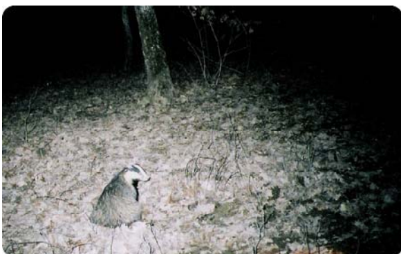
Promenade solitaire d'un blaireau.