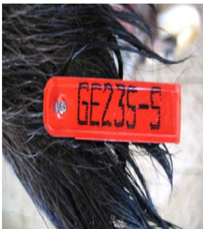
Marque auriculaire de sanglier. Le marquage de plusieurs centaines de sangliers dans le cadre d'un projet transfrontalier a permis de mieux comprendre leurs déplacements et de préciser leurs effectifs.

Ce programme, qui arrive à son terme en 2006 au niveau du terrain, devrait encore fournir de nombreuses indications utiles, une fois que toutes les données auront été analysées dans le cadre d'un programme Interreg, mené en collaboration avec la Chambre d'agriculture de Haute-Savoie et avec le soutien de l'Union européenne et de la Confédération.