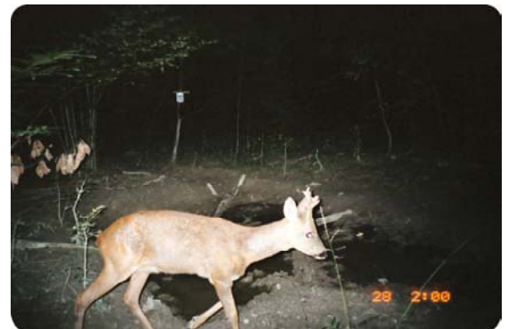
Haut les pattes ! Jeune brocard.