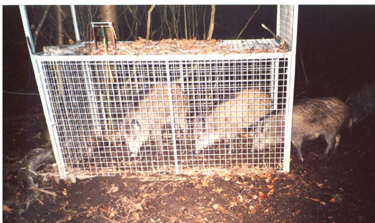
Sangliers attirés à l'aide de maïs dans une cage de capture.

FAUX. L'analyse des données disponibles sur les sangliers genevois montre que le canton abrite trois populations de sangliers séparées, entre lesquelles il n'y a pas ou très peu d'échanges, à savoir, celles des bois de Versoix, du sud-ouest du canton et des bois de Jussy. Ces trois populations sont transfrontalières, mais leurs déplacements sont limités par l'urbanisation et les voies de circulation et pour le sud de Genève, par l'obstruction de corridors à faune suite à de nouvelles constructions (p.ex. route départementale transgessienne). La majorité des sangliers genevois est très sédentaire, occupant des territoires de moins de 2 km 2 sur plusieurs mois. Seuls certains individus subadultes, surtout des mâles, effectuent des déplacements de plusieurs dizaines de kilomètres. Au niveau du Jura, des mouvements altitudinaux existent, mais ils sont encore peu connus. On observe aussi des remontées en hiver, liées probablement