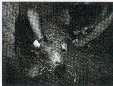
Capture d'un sanglier : une méthode bien standardisée et mise au point par le CNERA cervidés-sangliers permet de capturer et marquer les sangliers sans risque, ni pour l'opérateur ni pour l'animal très sensible au stress.

Le problème existe des deux côtés de la frontière mais il est traité différemment de part et d'autre : en France, les dégâts sont indemnisés par les fédérations de chasseurs mais celles-ci ont l'obligation financière de limiter le coût d'indemnisation, alors qu'en Suisse, rien de tel n'existe. C'est à l'agriculteur de se protéger, ce qui pèse